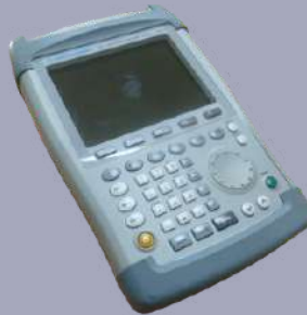
ANALIZADOR DE ESPECTRO