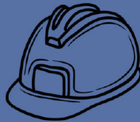
MATERIAL DE PROTECCIÓN