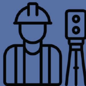
EQUIPOS MÓVILES TERESTRES