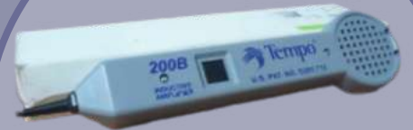
SONDA PARA SEGUIMIENTO