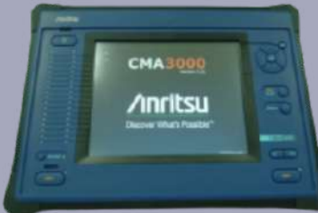
ANALIZADOR DE TRAMA