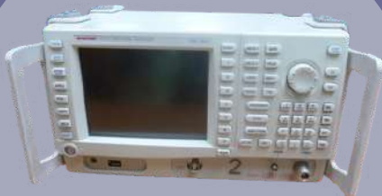
ANALIZADOR DE ESPECTRO