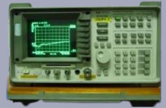
ANALIZADOR DE ESPECTRO